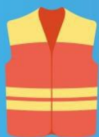
Яркая одежда со световозвращающими элементами